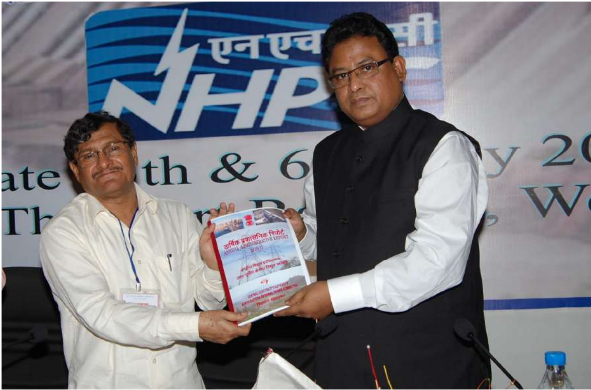
Releasing of Annual Report (2010-11) of NERPC by Shri A.T.Mondal, Hon' ble Power Minister, Govt. of Meghalaya & Chairman, NERPC and Shri Manik Dey, Hon'ble Power Minister, Govt. of Tripura during 11 th NERPC Meeting at Kolkata.