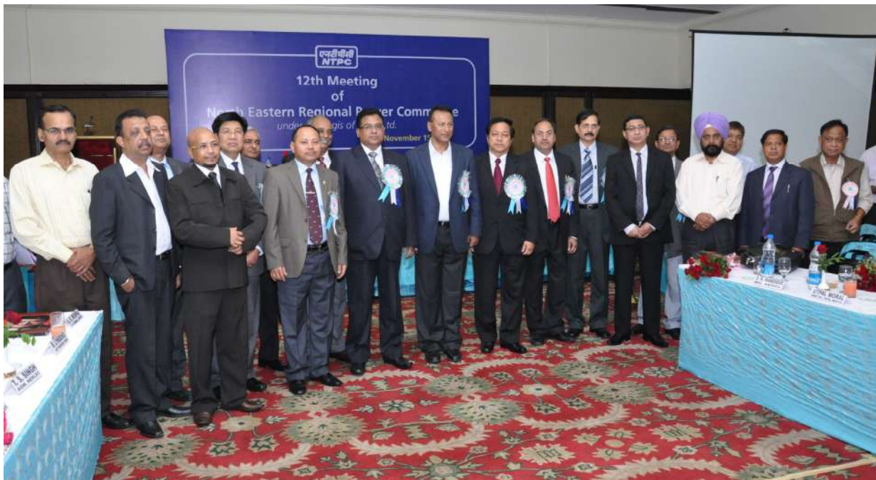
12 th NERPC Meeting at Amritsar