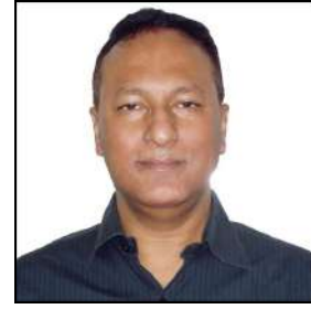
श्री प्रद्युत बोर्डोलोई,

Hon'ble Minister of Power, Govt. of Arunachal Pradesh