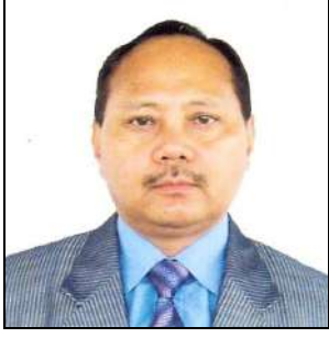
श्री दोशिही वाई. सेमा, माननीय विद्युत मन्त्री, नगालैण्ड सरकार Shri Doshehe Y. Sema, Hon'ble Minister of Power, Govt. of Nagaland