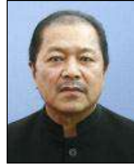
श्री लाल थानहावला,

Hon'ble Chief Minister & Minister of Power, Govt. of Manipur