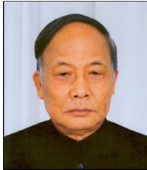
श्री ओ. आई. सिंह,

Hon'ble Minister of Power, Govt. of Assam