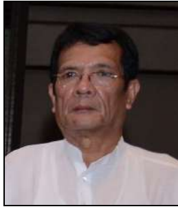
श्री टन्गा बयालिंग,

Hon'ble Minister of Power, Govt. of Meghalaya & Chairman, North Eastern Regional Power Committee